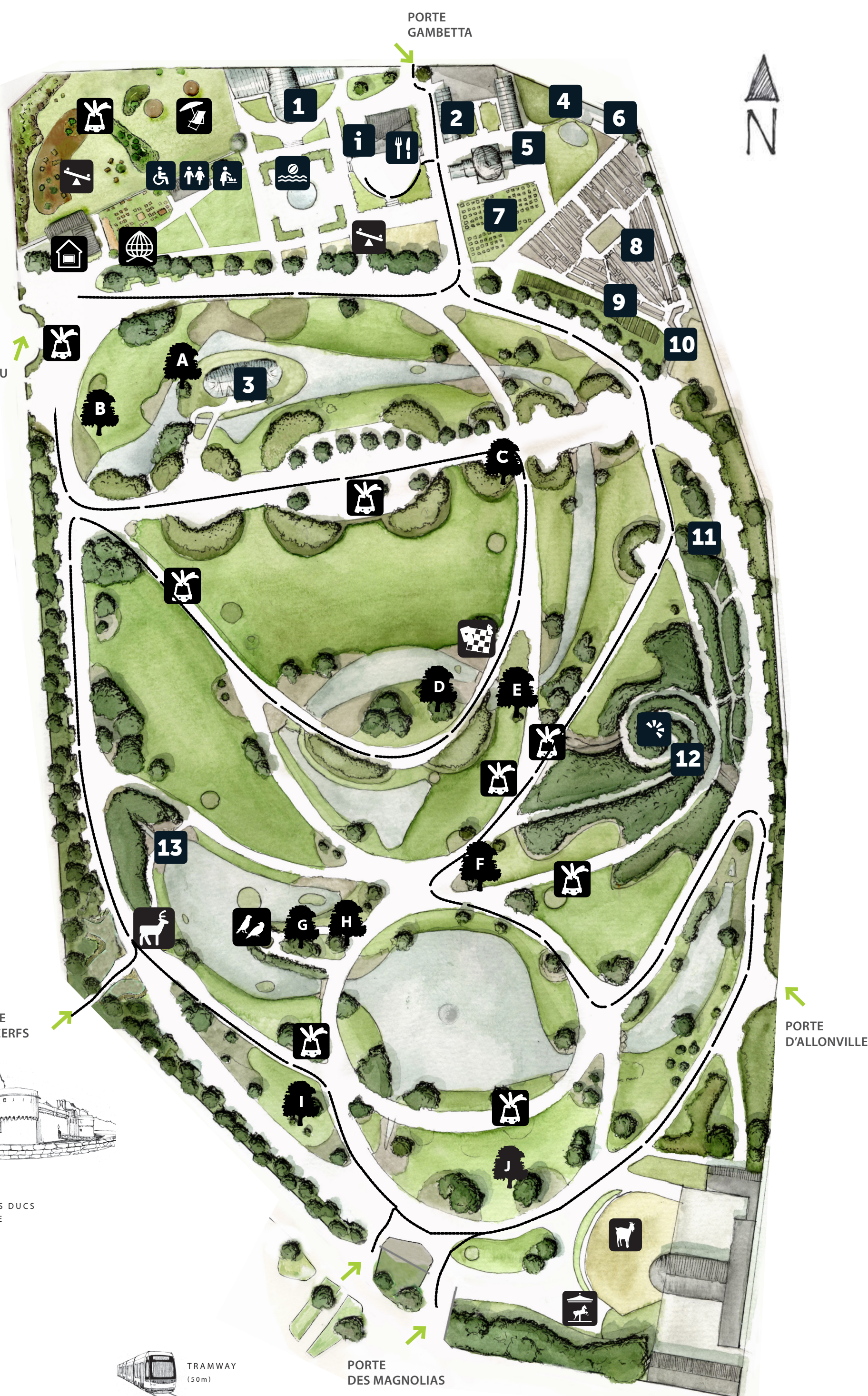
PORTE DES CERFS