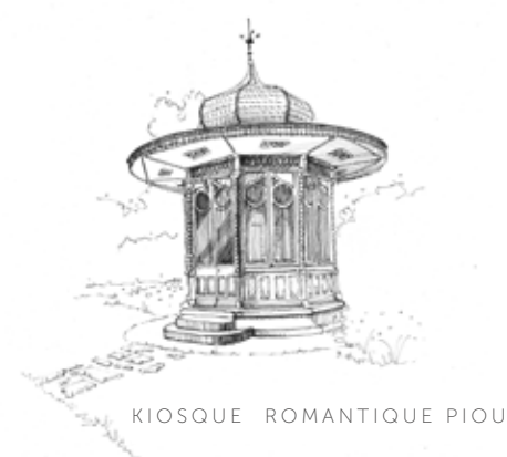
KIOSQUE ROMANTIQUE PIOUS