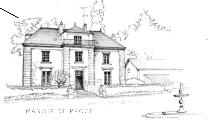
MANOIR DE PROCÉ