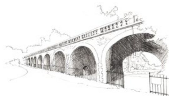
PONT JULES CÉSAR